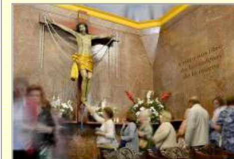
Parroquia del Ssmo. Cristo de las Cadenas y Latores

Ya está disponible el Calendario Parroquial para el próximo año 2020. Se han hecho 230 ejemplares, que se distribuyen gratuitamente.